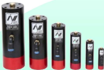
NSV 密閉型 i シリーズ