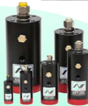
NSV 突出型 Eシリーズ