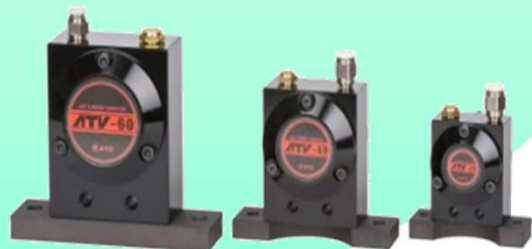
タービン型 ATVシリーズ