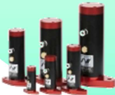
NSV ノッカー型 Kシリーズ